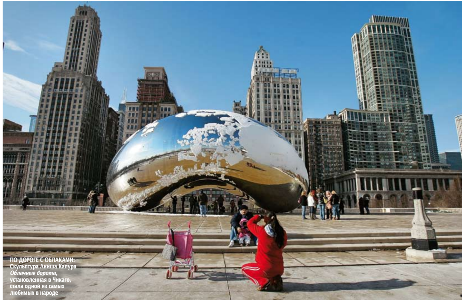
ПО ДОРОГЕ С ОБЛАКАМИ: Скульптура Аниша Капура Облачные ворота , установленная в Чикаго, стала одной из самых любимых в народе

— Это ключевой вопрос, и он возникает всегда и везде. Важно, чтобы у художника был собственный голос. Ведь всю нашу жизнь что, собственно, с нами делают? Учат. Начиная со школы, затем в обществе