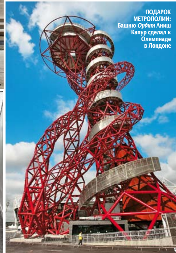
ПОДАРОК МЕТРОПОЛИИ: Башню Орбит Аниш Капура сделал к Олимпиаде в Лондоне