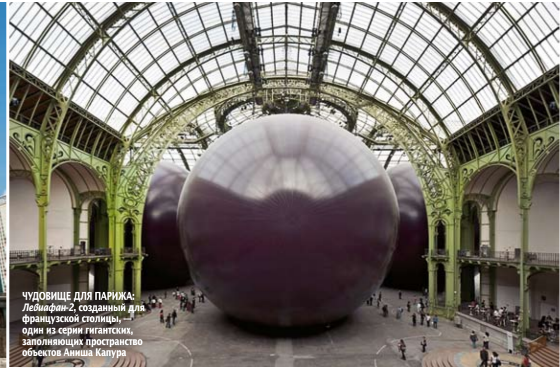
ЧУДОВИЩЕ ДЛЯ ПАРИЖА: Левиафан-2 , созданный для французской столицы, — один из серии гигантских, заполняющих пространство объектов Аниша Капура

— Это очень сложный вопрос. Ведь каждый приходит со своим багажом, с историей всей своей жизни. И автор не знает, что происходит в данном пространстве — между его работой и зрителем. Но что бы там ни было, это очень важно. И, пожалуй, самая трогательная реакция, которую я видел, — слезы. Несколько раз такое видел, и в этом была какая-то... нежная поэзия. ■