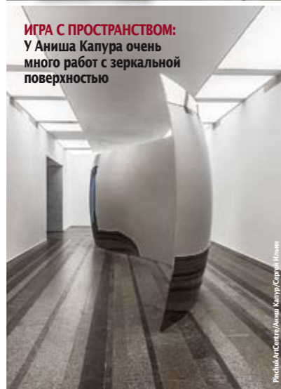
ИГРА С ПРОСТРАНСТВОМ: У Аниша Капура очень много работ с зеркальной поверхностью