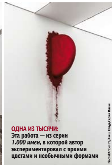
ОДНА ИЗ ТЫСЯЧИ: Эта работа — из серии 1.000 имен , в которой автор экспериментировал с яркими цветами и необычными формами