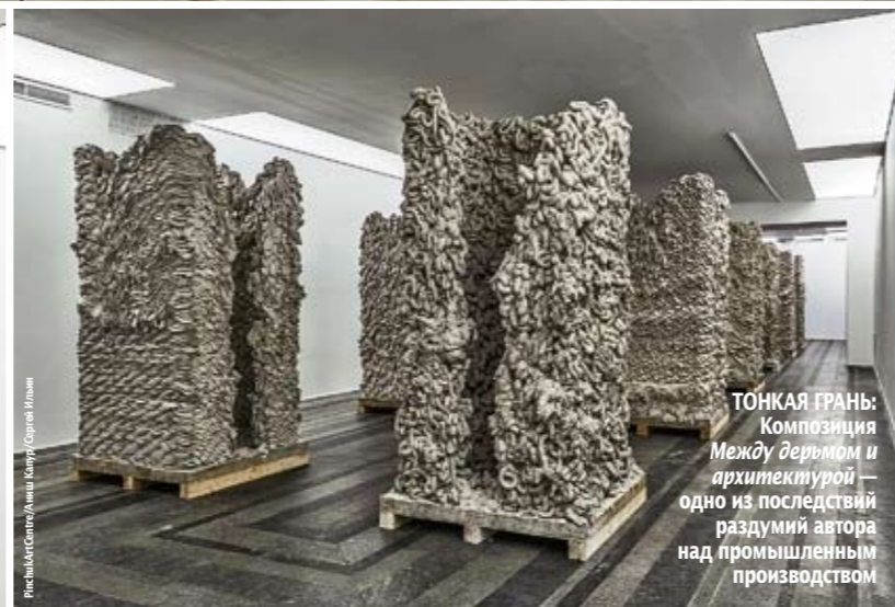
ТОНКАЯ ГРАНЬ: Композиция Между деревом и архитектурой — одно из последствий раздумий автора над промышленным производством

нас учат, учат, учат. И только став творческой личностью, ты можешь освободиться от этого и заявить: “Я не знаю, что я делаю”.