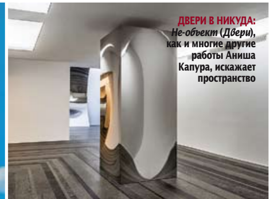
ДВЕРИ В НИКУДА: Не-объект ( Двери ), как и многие другие работы Аниша Капура, искажает пространство

▼ МРАК МОЙ ЗЕРКАЛЬЦЕ, СКАЖИ: Темные изогнутые зеркала, в которых отражение в какой-то момент исчезает, — одна из фишек индийского скульптора