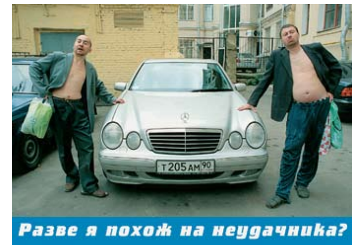
[11-12]. Група «Сині носи» Із серії «На дні»