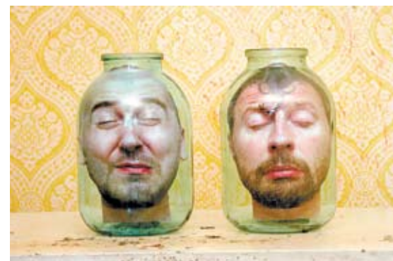
[9]. Група «Сині носи» Кольорова фотографія