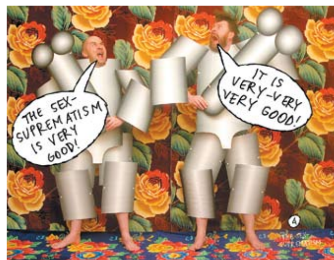
[10]. Група «Сині носи» Sex_suprematism